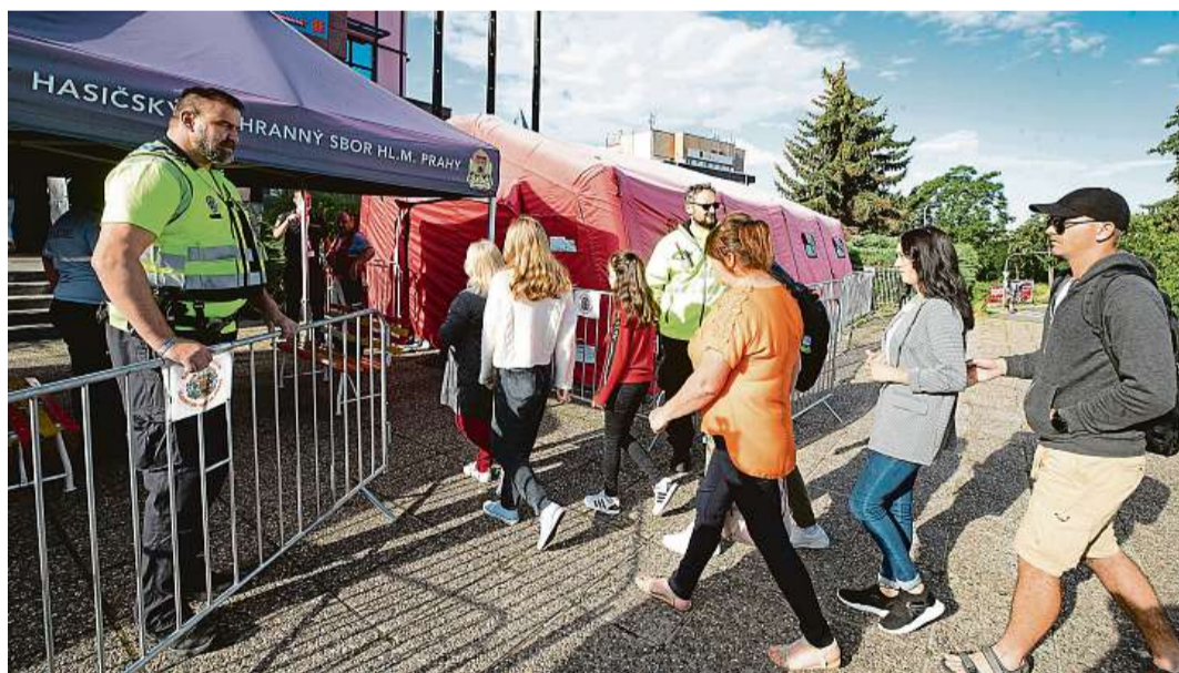
Opět otevřeno. V Praze začalo znovu fungovat uprchlické centrum. Přišly stovky Ukrajinců.

Trvalé ubytování v městských bytech a ubytovnách už ale ne. Praha nově nabízí jenom možnost strávit pár nocí v provizorních stanových městečkách nebo v azylových střediscích Správy uprchlických zařízení. Pak si každý musí najít bydlení sám. Běženci se proto nejčastěji obrací s prosbou o pomoc na své příbuzné a známé, kteří už v Česku žijí. Tak jako například drobná dvacátice Anna, jež